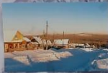
Вид со скалы Саранской