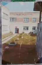
Детский сад №28 в Саранске