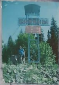
Скала при выезде в Россию