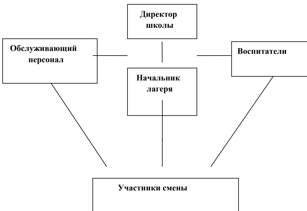
Схема управления программой

Обязанности обслуживающего персонала определяются начальником лагеря. Начальник, педагогический коллектив, обслуживающий персонал отвечают за соблюдение правил техники безопасности, выполнение мероприятий по охране жизни и здоровья воспитанников во время участия в соревнованиях, массовых праздниках и других мероприятиях.